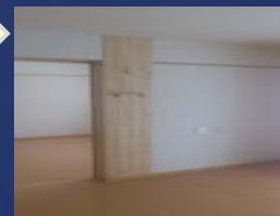
地味内外装材施工完了