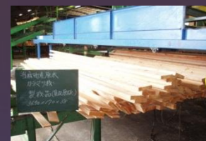
当麻町森林組合にてラミナ加工