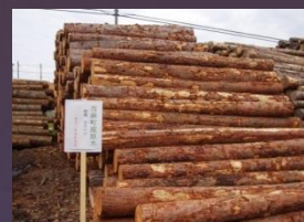
当麻町森林組合土場へ原木をストック