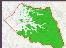
当麻町の65%を森林が占める