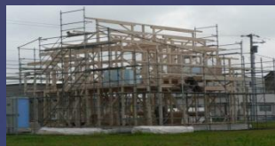
地味構造材建方完了