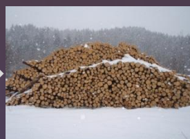
山林土場へ原木をストックする